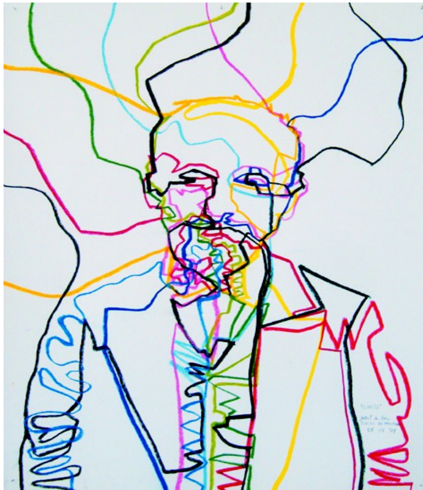
"Louis" (Ducos du Hauron) 2009