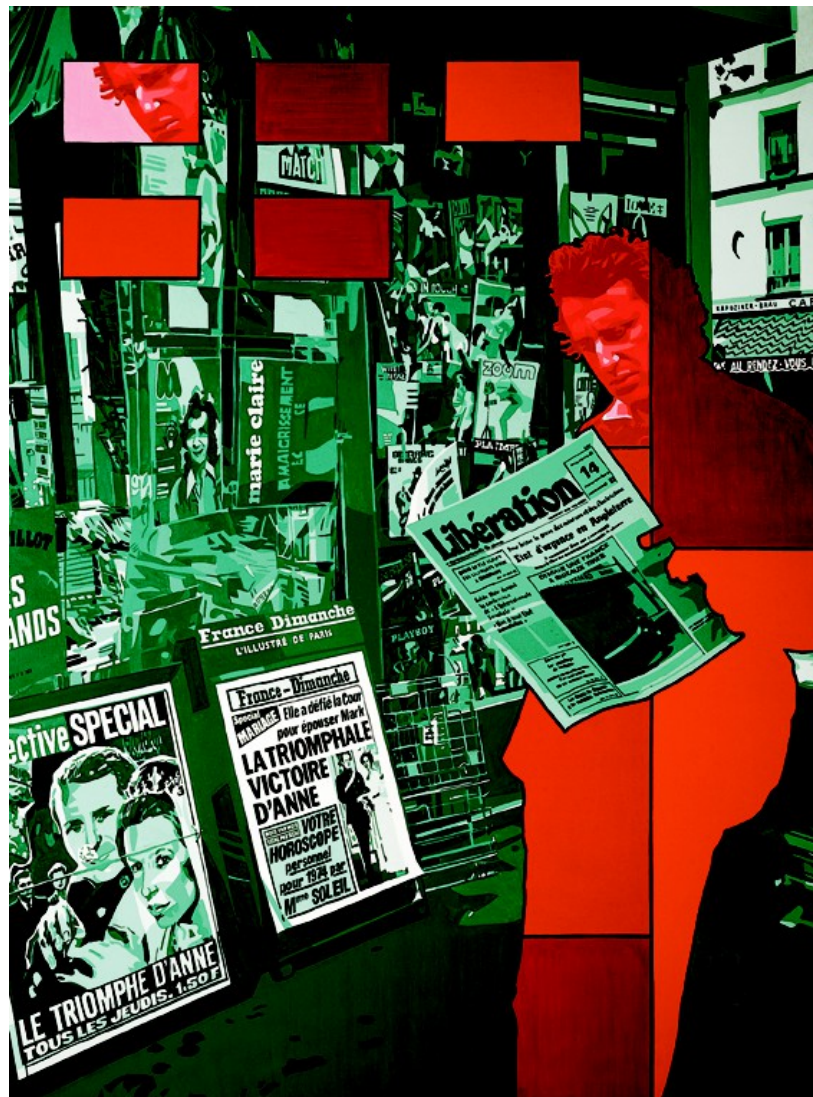
"Comment dites-vous ?" 1973

Aux Abattoirs d'Avallon, "La couleur en action" vérifie comment l'œuvre du peintre ne se restreint pas à une recherche hors du temps. Gérard Fromanger veut que sa peinture participe à cette réflexion sur son époque, qu'elle s'inscrive dans les engagements indissociables de sa position d'homme témoin et acteur des tensions du monde. Avec les trois thèmes présentés aux Abattoirs : "Le spectacle du monde", "Le temps des Batailles", "Au cœur des Bastilles", cette implication du peintre dans son temps confirme cette volonté exprimée par Gérard Fromanger : " Le monde n'est pas un spectacle, ni une représentation. Je suis dans le monde, pas devant le monde. "