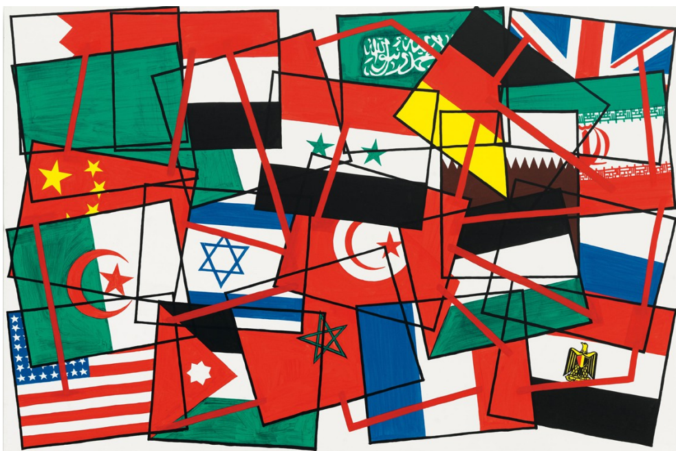
« Hommage à Gustave Courbet, de la Commune de Paris à la place Tahrir » 2011