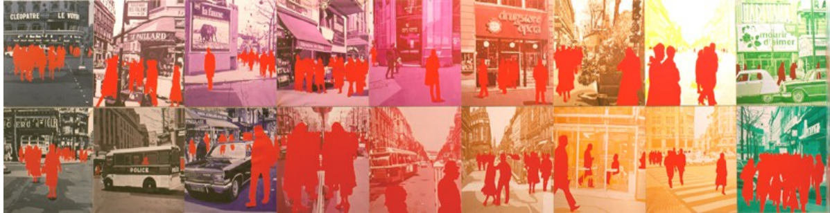
Série Boulevard des Italiens 1971