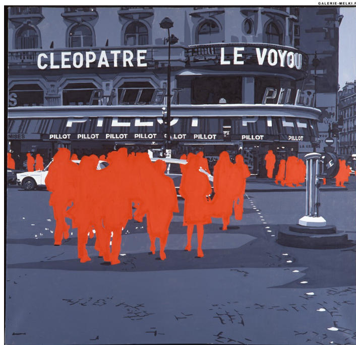
"Le voyou" série "Boulevard des Italiens" 1971

"Annoncez la couleur !" met l'œuvre de Fromanger en perspective avec celle du trop peu connu Louis Ducos du Hauron, dont l'invention de la photographie couleur en trichromie en 1869 fut décisive dans l'aventure de notre image contemporaine. Sur plus d'une cinquantaine de séries, Gérard Fromanger opère un jeu de déconstruction-reconstruction de l'image avec la mise au premier plan des composantes de cette trichromie. Le rouge Fromanger, décrit par Jacques Prévert, participe à cet investissement dans la couleur, toutes les autres ayant droit de cité à même titre que ce rouge inscrit désormais dans l'histoire de cette œuvre toujours en prise directe avec son temps.